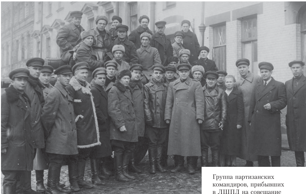
Группа партизанских командиров, прибывших в ЛШПД на совещание