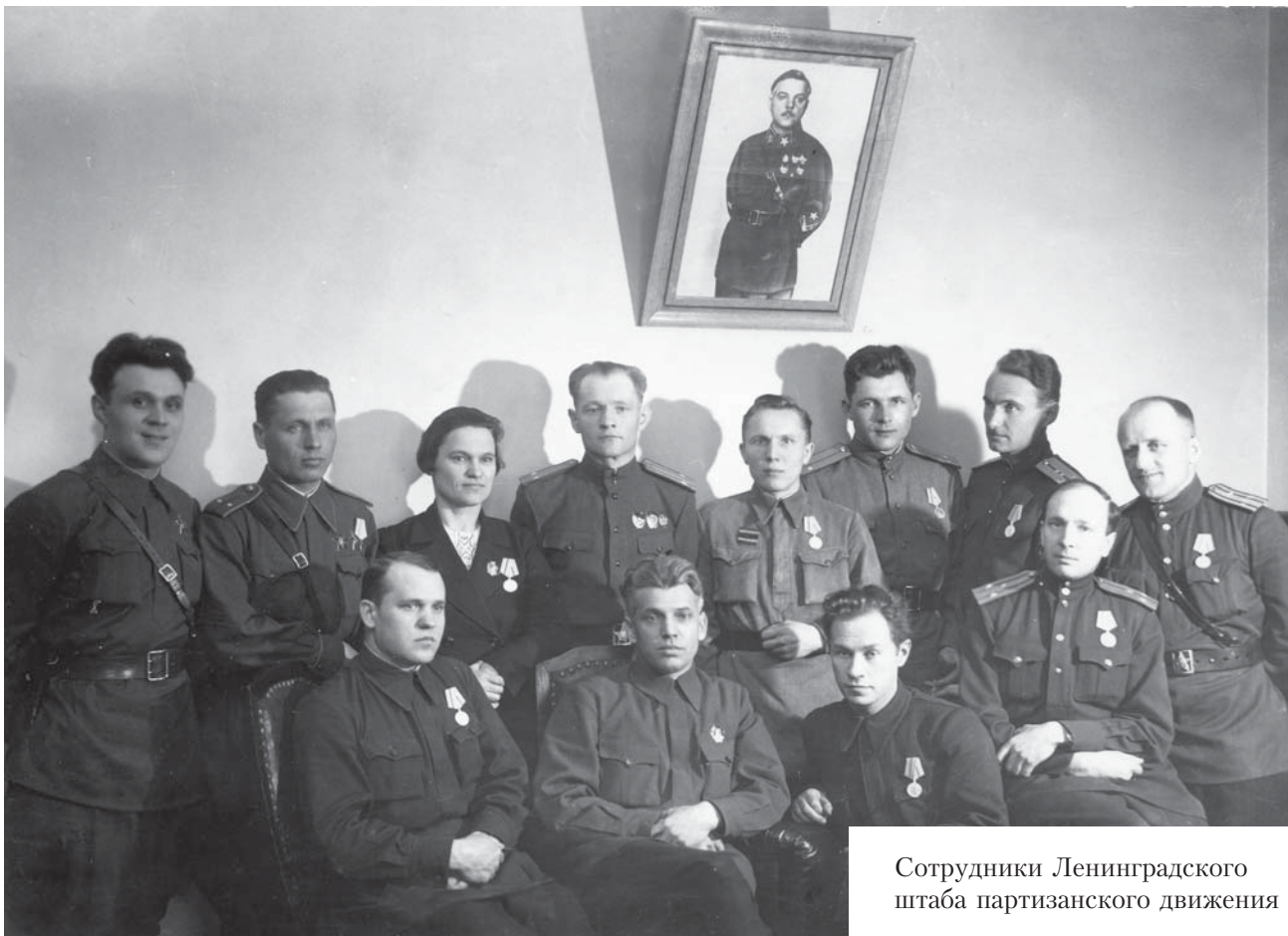
Сотрудники Ленинградского штаба партизанского движения