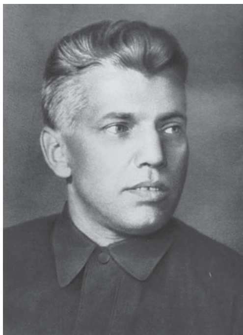
М.Н. Никитин – начальник Ленинградского штаба партизанского движения