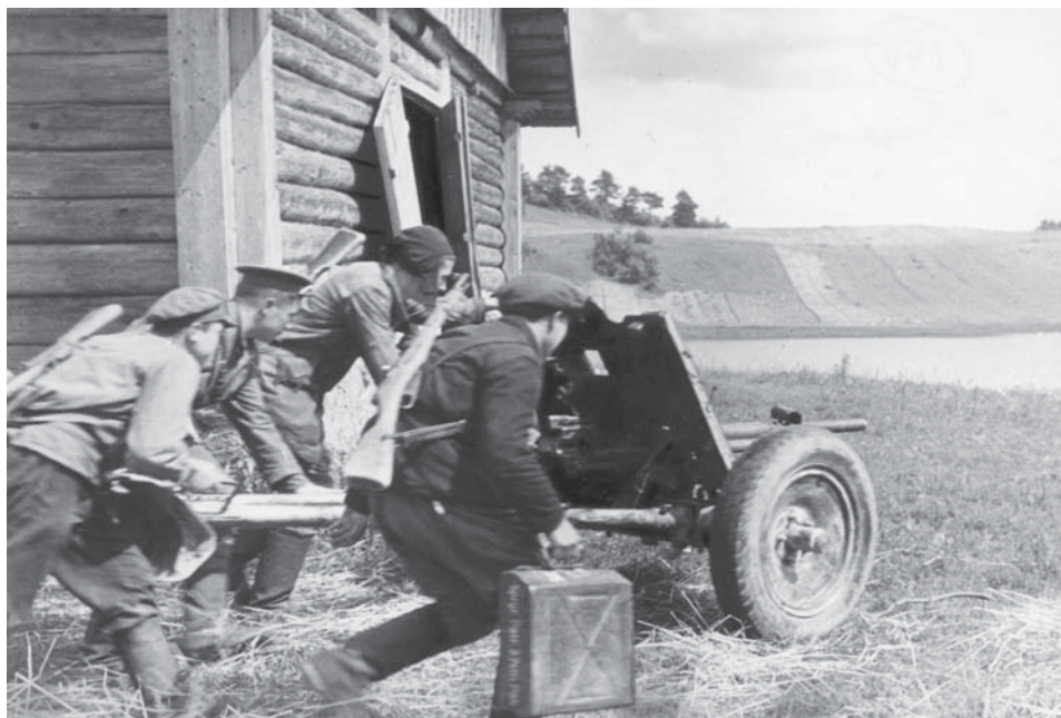
Захваченную у немцев пушку партизаны выкатывают на огневую позицию для стрельбы прямой наводкой

Вторую «сорокапятку» подобрали колхозники деревни Каменка Уторгошского района и вместе с оставшимися ящиками снарядов спрятали в стогу сена, к которому не подходили целых два года. С приходом партизан стог был разбросан. Колхозники выкатили пушку, выделили для нее лучшую лошадь и передали народным мстителям.