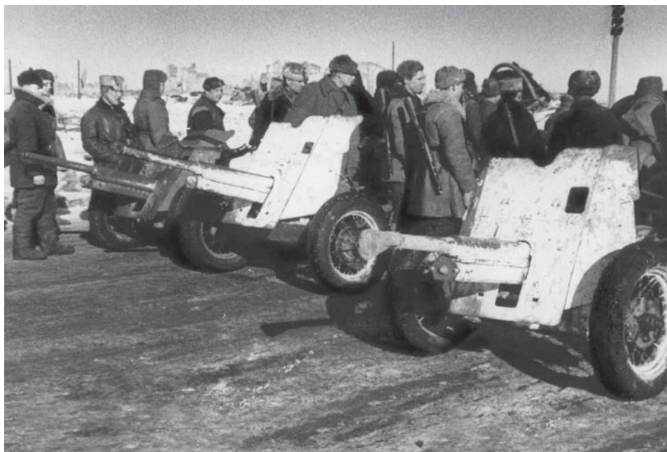
Противотанковые орудия 5-й ЛПБ. Как правило, они устанавливались в засадах – на дорогах для стрельбы прямой наводкой по живой силе и технике противника