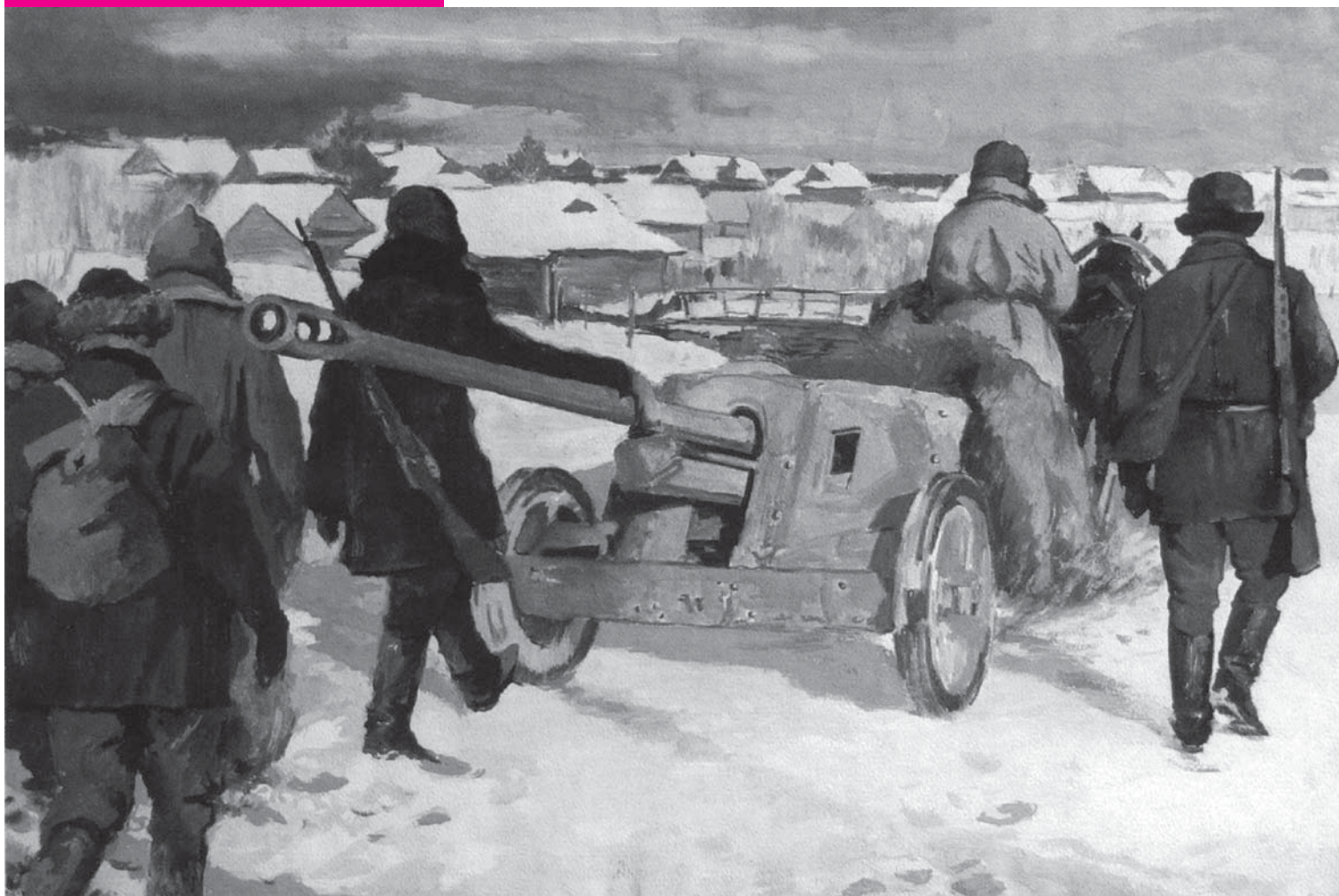
«Трофейная пушка». Картина партизанского художника А.А. Блинкова