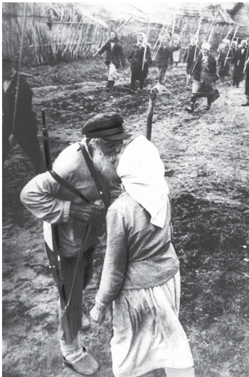
На защиту Партизанского края