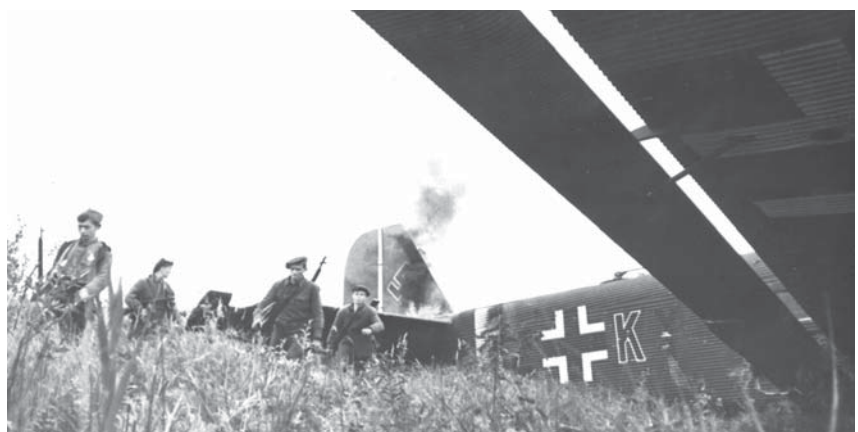
Немецкий самолет подбит