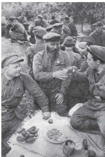
Отмечается годовщина создания Партизанского края

Партизанский край – уникальное явление не только в истории Великой Отечественной войны, но и в истории многих других войн: в тылу наступавшей оккупационной армии был создан и прочно удерживался огромный район, население которого продолжало жить по экономическим и государственным законам своей страны.