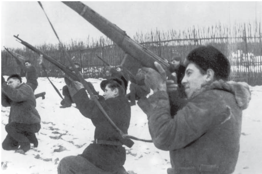
Огонь по вражеским самолетам