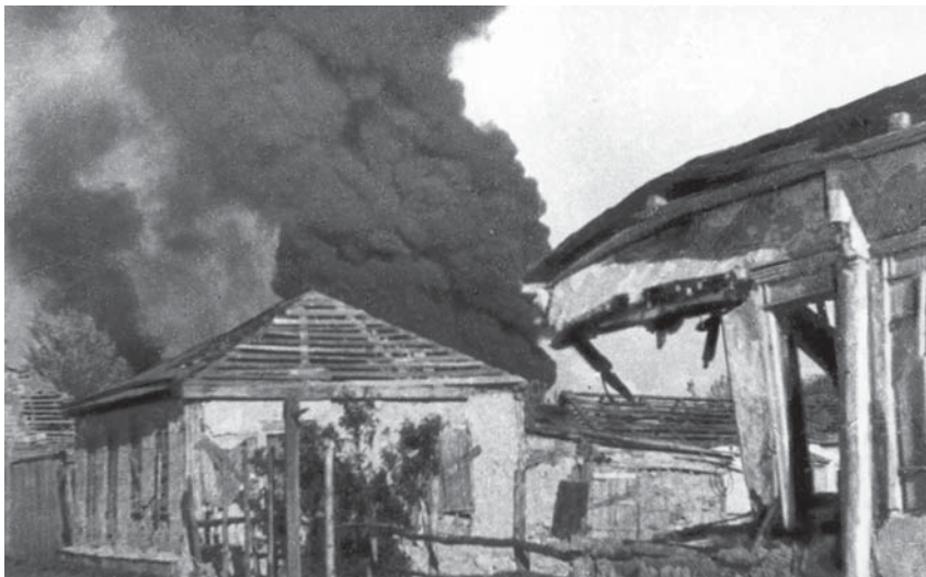
Горит деревня Видони Уторгошского района, подоженная карателями

Так сложилось, что именно над Партизанским краем пролегла вычерченная немецкими штурманами трасса, которая стала воздушным мостом для снабжения гитлеровской группировки, запертой в Демянском «котле».